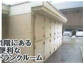
1階にある 便利な トランクルーム