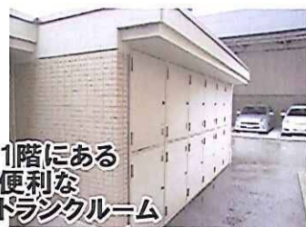
1階にある 便利な トランクルーム