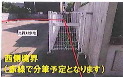
西側境界 (赤線で分筆予定となります)