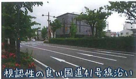
視認性の良い国道41号線沿い