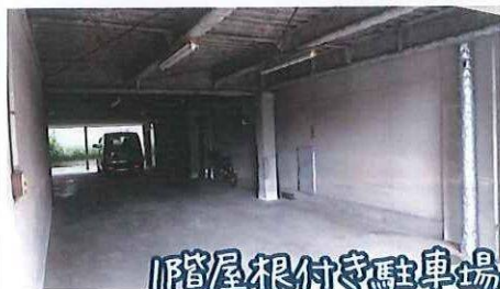
1階屋根付き駐車場